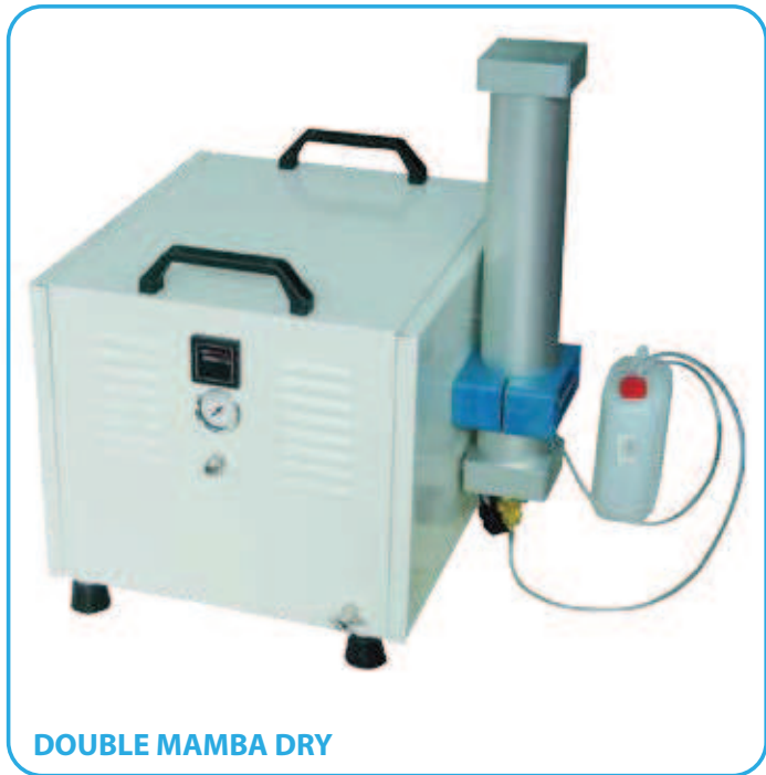
DOUBLE MAMBA DRY