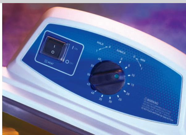
Serie Branson M